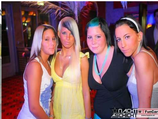
Abbildung 3 Krocha-Mädchen