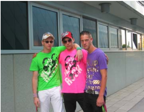
Abbildung 2 Krocha-Burschen

Mittelfristig wird in Böheimkirchen insgesamt eine Entwicklung weg vom Traditionalismus stattfinden (Reiterer 2003, Schipfer 2005). Die Zahlen der Jungmitglieder in den Vereinen werden weiter rückläufig sein und die Überantwortung von „anderen Jugendlichen“ in den Zuständigkeitsbereich eines externen Trägers wird nicht ausreichen, um dem mit der Urbanisierung einhergehenden Sozialen Wandel gerecht zu werden. Aus ForscherInnensicht wird es mittelfristig engagierter VertreterInnen für Jugendagenden sowie versierter Ressortverantwortlicher in der Gemeinde selbst bedürfen, die sich für (alle) jugendliche(n) Lebenswelten und Inszenierungen selbst interessieren und die das Thema „Jugend“ zu einem öffentlichen Interesse erheben. Problematische Artikulationen und Lebensstile der jungen Generation, Fragen der Entwicklung von mittelfristigen Perspektiven und Plänen sowie jene der Positiv-Ausblicke sollten auf der Tagesordnung jenes ExpertInnengremiums sein, das dem Jugendausschuss zu Beratungszwecken zur Verfügung steht. Die nachstehenden Abbildungen von Krocha-Inszenierungen, die in der Böheimkirchner Öffentlichkeit Irritation und Unverständnis auslösten (ExpertInnengespräch H, C) sollen verdeutlichen, dass ExpertInnen-Gremien sich auch mit Fragen von jugendlichen Stilen und Kulturen auseinandersetzen müsste und deren Logik verstehen sollte.